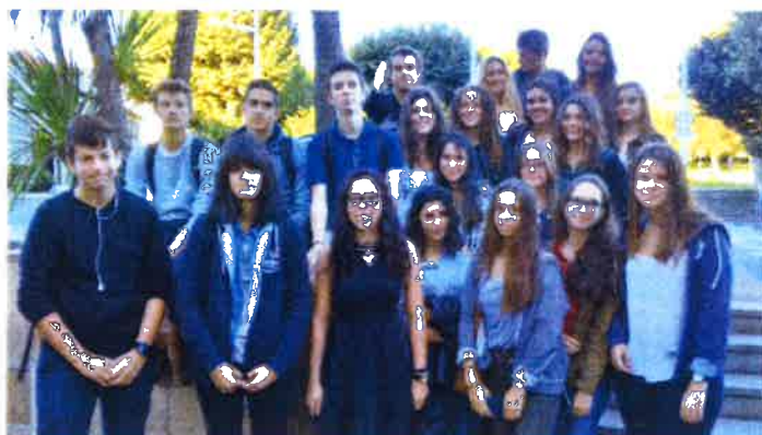
Gracias al instituto René Cassin por permitir esta salida y también a los Profesores.

Por la tarde asistimos a la proyección de la segunda película Pinamar cuyo tema es el paso de la adolescencia a la vida adulta. Pero, la opinión del grupo es negativa. ¡ No nos gustó !