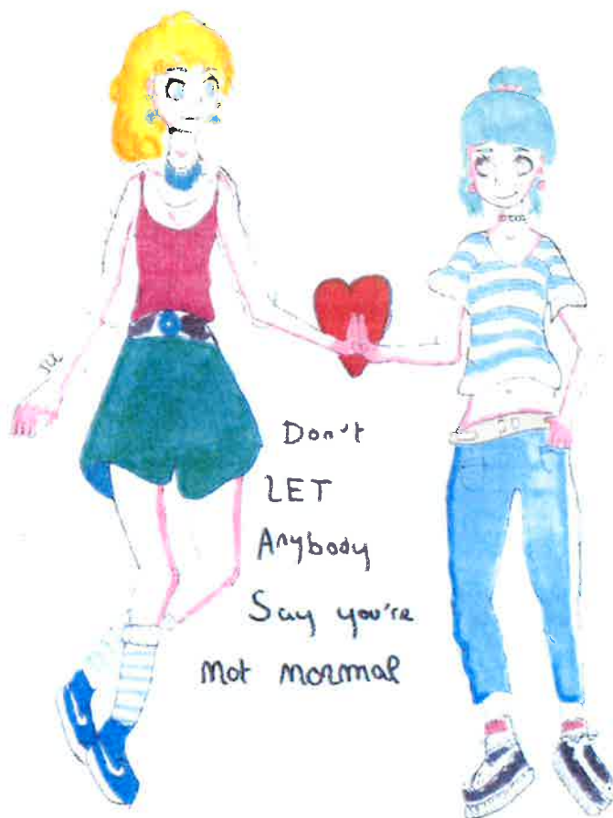
Dessins du Marcassin réalisés par nos dessinateurs.